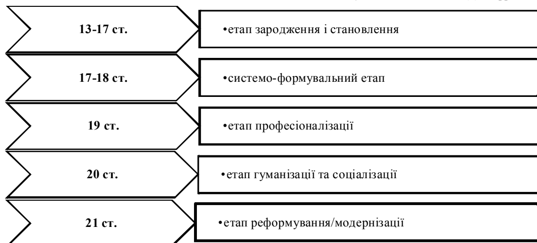
Рис. 2. Етапи становлення і розвитку медичної освіти в університетах Великої Британії

3. Bates V. Yesterday's Doctors: The Human Aspects of Medical Education in Britain, 1957-93 / V. Bates // Medical History . – 2017. – Vol. 61 (1). – pp.48–65