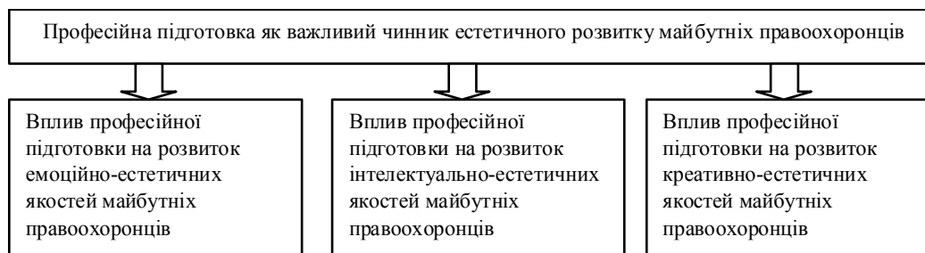
Рис. 1. Відображення професійної підготовки як важливого чинника естетичного розвитку майбутніх правоохоронців

В умовах професійної підготовки майбутніх правоохоронців важливо спрямувати освітньо-педагогічні зусилля на розвиток таких емоційно-естетичних якостей, як вміння естетично сприймати предмети і явища, виявляти інтерес до проявів естетичного в навколишній дійсності, відчувати емоційний характер та ціннісну забарвленість професійних дій, уміння співпереживати та емоційно реагувати на естетичні прояви в системі професійної діяльності, контролювати власні емоції та почуття, виявляти уважне ставлення до розвитку естетичних почуттів, смакових уподобань, ціннісних орієнтацій та ідеалів. У науковій літературі наголошується на ролі професійної підготовки у розвитку емоційно-естетичної активності курсантів вищих навчальних закладів МВС України.