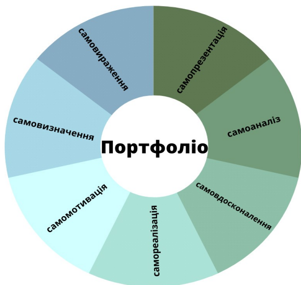
Рис. 2 Діаграма контенту портфоліо педагога

Уважаємо, що виправдано послуговуватися портфоліо як засобом представлення індивідуальних досягнень вчителя, оскільки цей документ фіксує персональні успіхи з метою реалізації професійного потенціалу і покращання викладацької діяльності. Отож, пропонуємо основні складові електронного портфоліо, що стосуються власного розвитку вчителя, які представлено в діаграмі, рисунок 2.