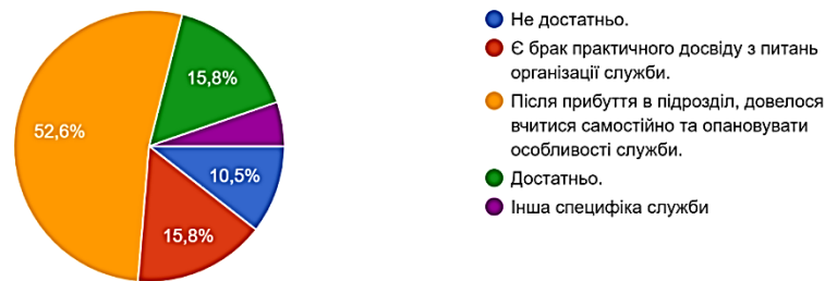
Рис. 2. Розподіл відповідей респондентів на питання “Чи достатньо задовольняли вас сформовані практичні навички для організації служби у ВЧ (ІІ) з ОГП НГУ?”

2) з виникненням нових завдань, пов’язаних з метою запобігання поширенню на території України гострої респіраторної хвороби COVID-19, запровадження правового режиму воєнного стану,