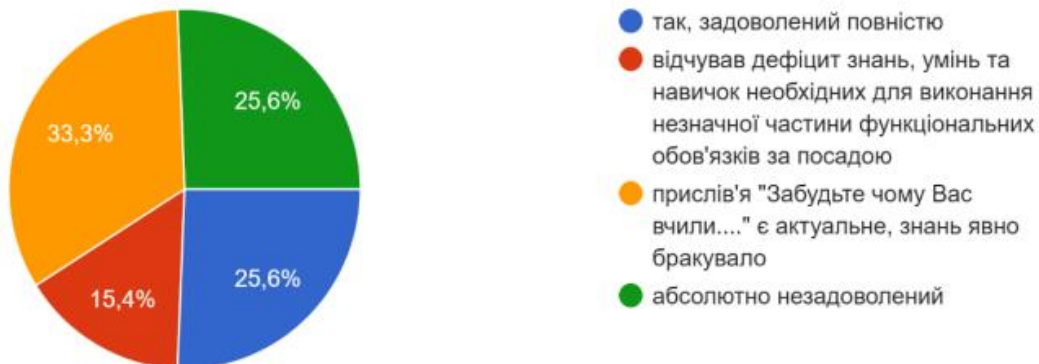
Рис. 1. Розподіл відповідей на питання “Чи задоволені Ви сформованими компетентностями під час навчання за освітньою програмою? Чи дали вони можливість впевнено пройти становлення у перші роки військової служби на посаді?”

2) для виключення названих проблем у майбутньому офіцерами запропоновано ввести такі зміни до напрямку підготовки: збільшити кількість практичних занять, які пов’язані з бойовою складовою; за можливості збільшити кількість практичних занять з використанням сучасного технічного обладнання; посилити змістову складову військових дисциплін та дисциплін, які визначають порядок застосування сучасних технічних засобів; запровадити навчальну дисципліну “Застосування БПЛА та БАК оперативними підрозділами НГУ”.