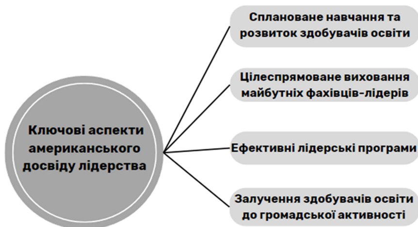
Рис. 1. Ключові аспекти американського досвіду лідерства

лідерські прояви, самоцінність та можливості власного впливу. За словами дослідниці, лідерство у США розвивається як інтегративна характеристика особистості та здатності здобувачів освіти до співпраці з різними верствами населення і у різних умовах (Рис. 1).