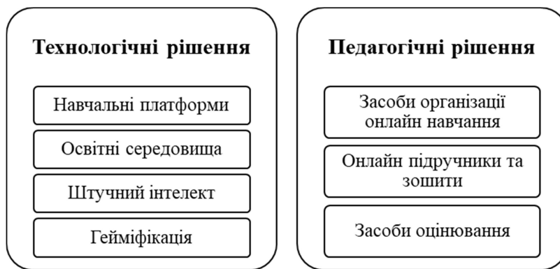
Рис. 1. Технологічні та педагогічні цифрові рішення організації освітнього процесу здобувачів педагогічної освіти

Основними цифровими інструментами удосконалення компетентностей здобувачів педагогічної освіти є технологічні та педагогічні рішення, що відображені на рис. 1.