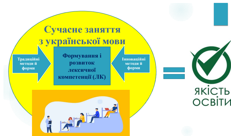
Рис. 1. Ілюстрована формула забезпечення якісного сучасного заняття з української мови у аграрному вищій